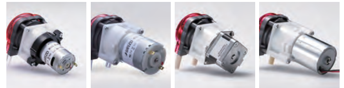
DCブラシモータ DCブラシモータ (静音・高寿命タイプ) ステッピングモータ ブラシレスモータ

DC12・24Vの低速・中速・高速モータ/ステッピングモータ/ブラシレスモータなど、各種モータを実装したタイプも取り揃えています。